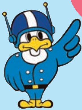
長野県警察 シンボルマスコット 「ライポくん」