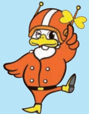
長野県警察 シンボルマスコット 「ライピちゃん」